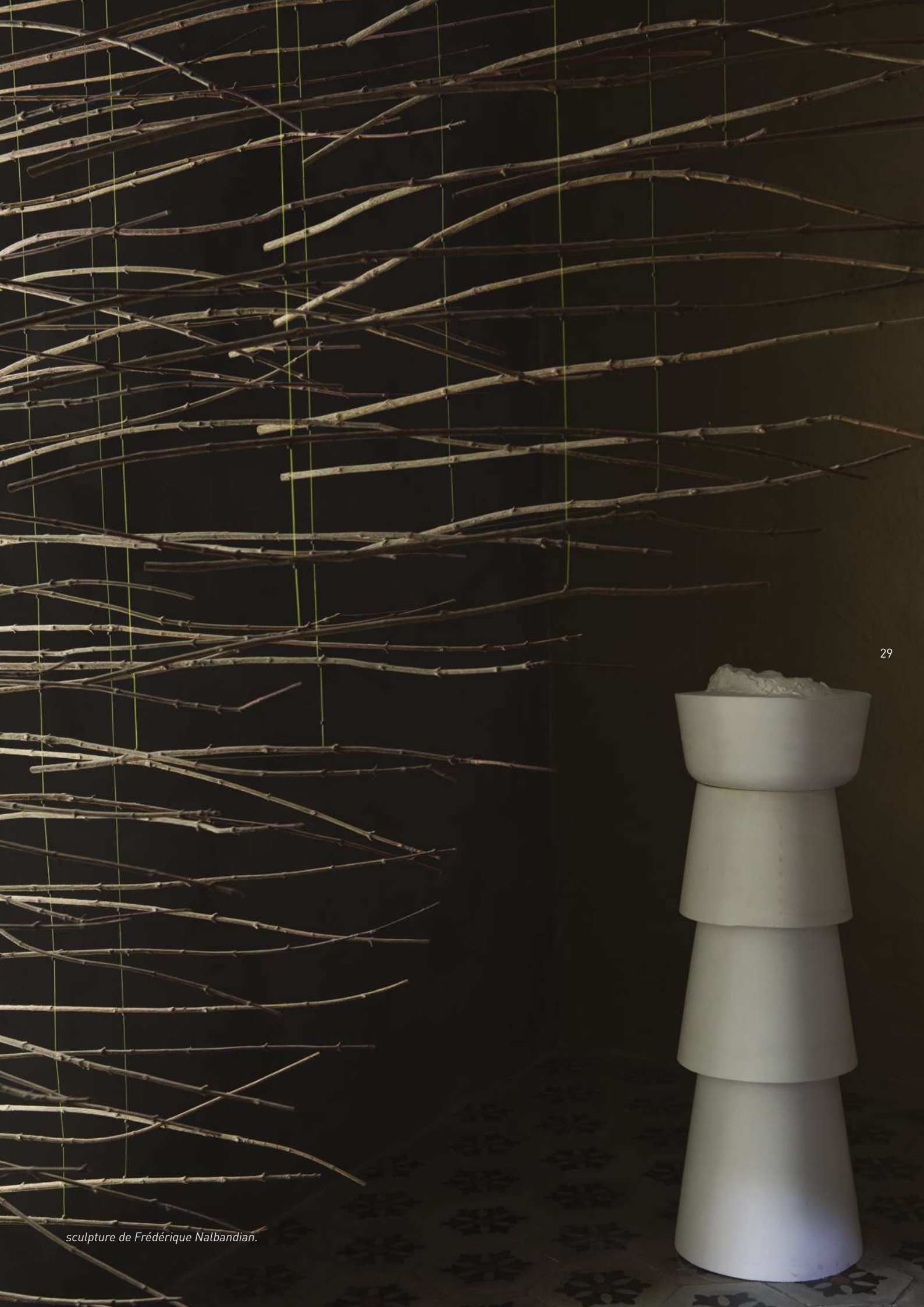
sculpture de Frédérique Nalbandian.