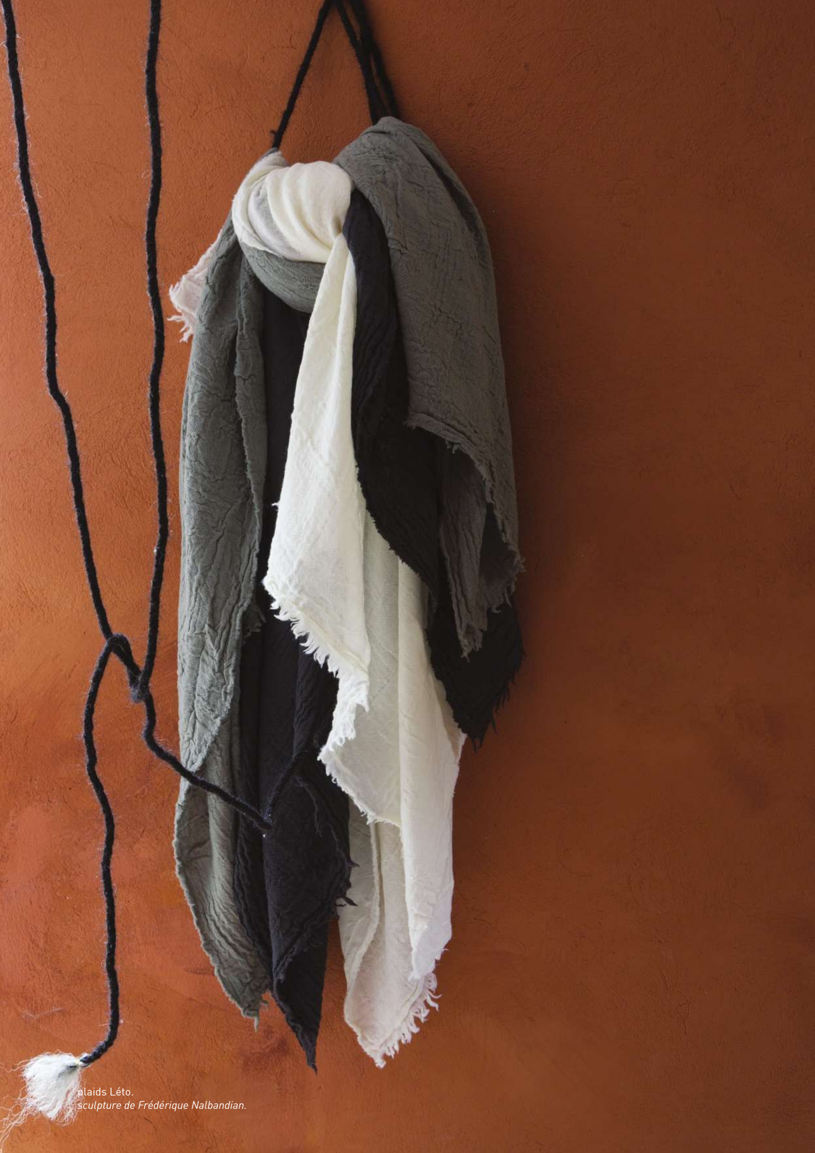
plaids Léto. sculpture de Frédérique Nalbandian.