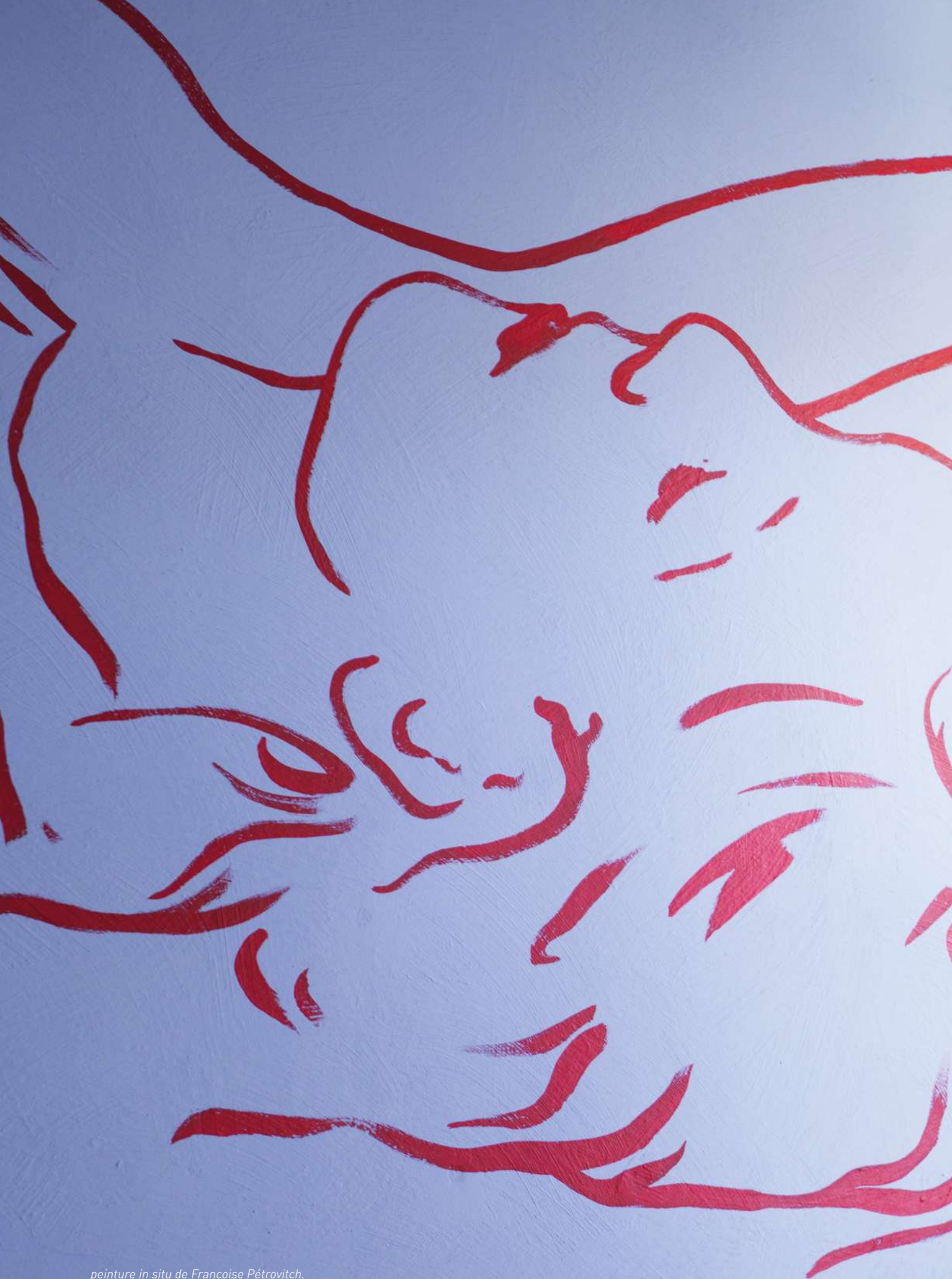
peinture in situ de Françoise Pérovitch.