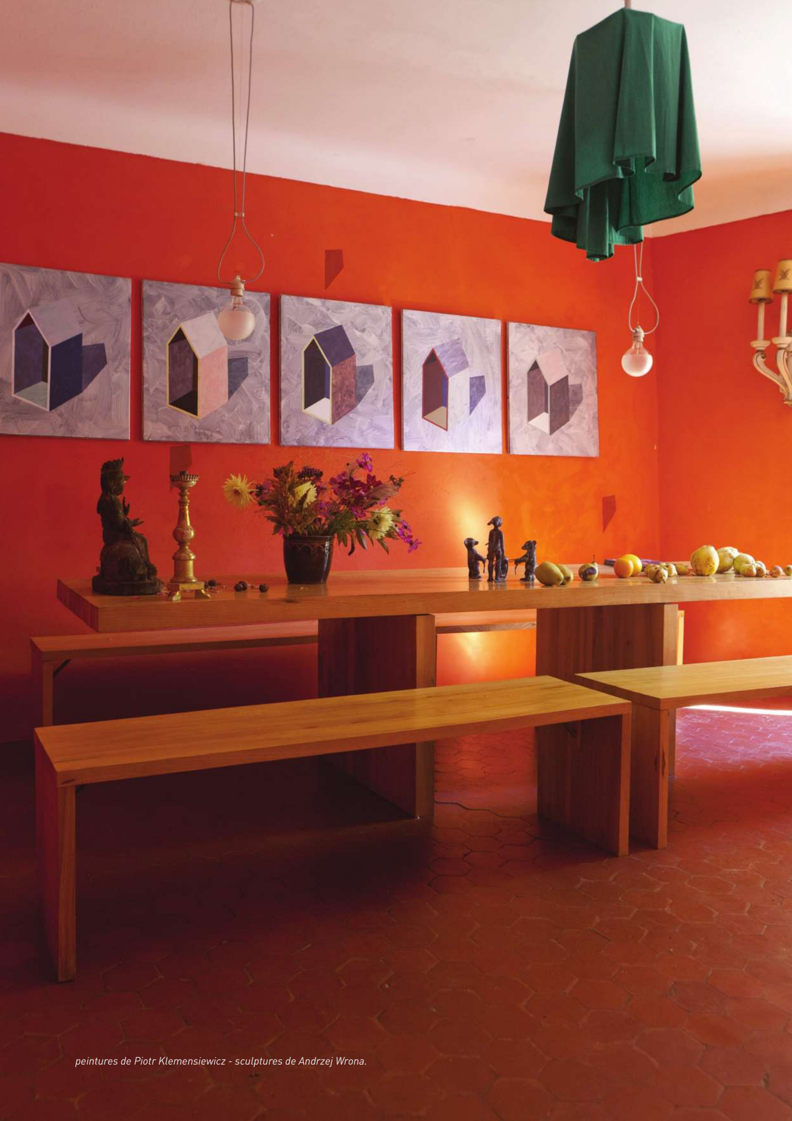
peintures de Piotr Klemensiewicz - sculptures de Andrzej Wrona.