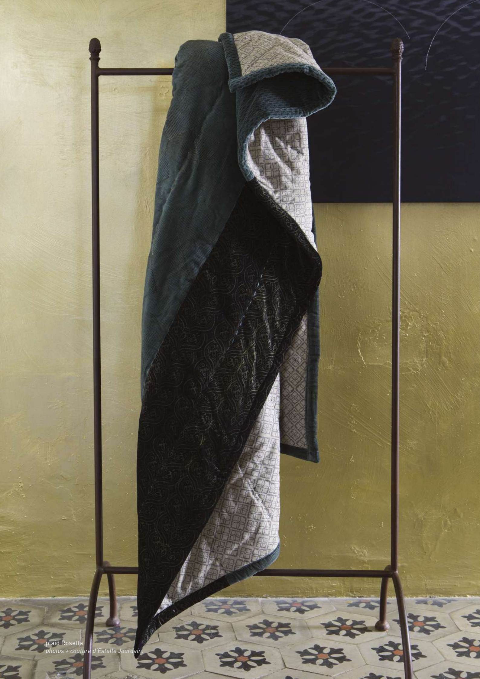
plaid Rosetta. photos + couture d'Estelle Jourdain.