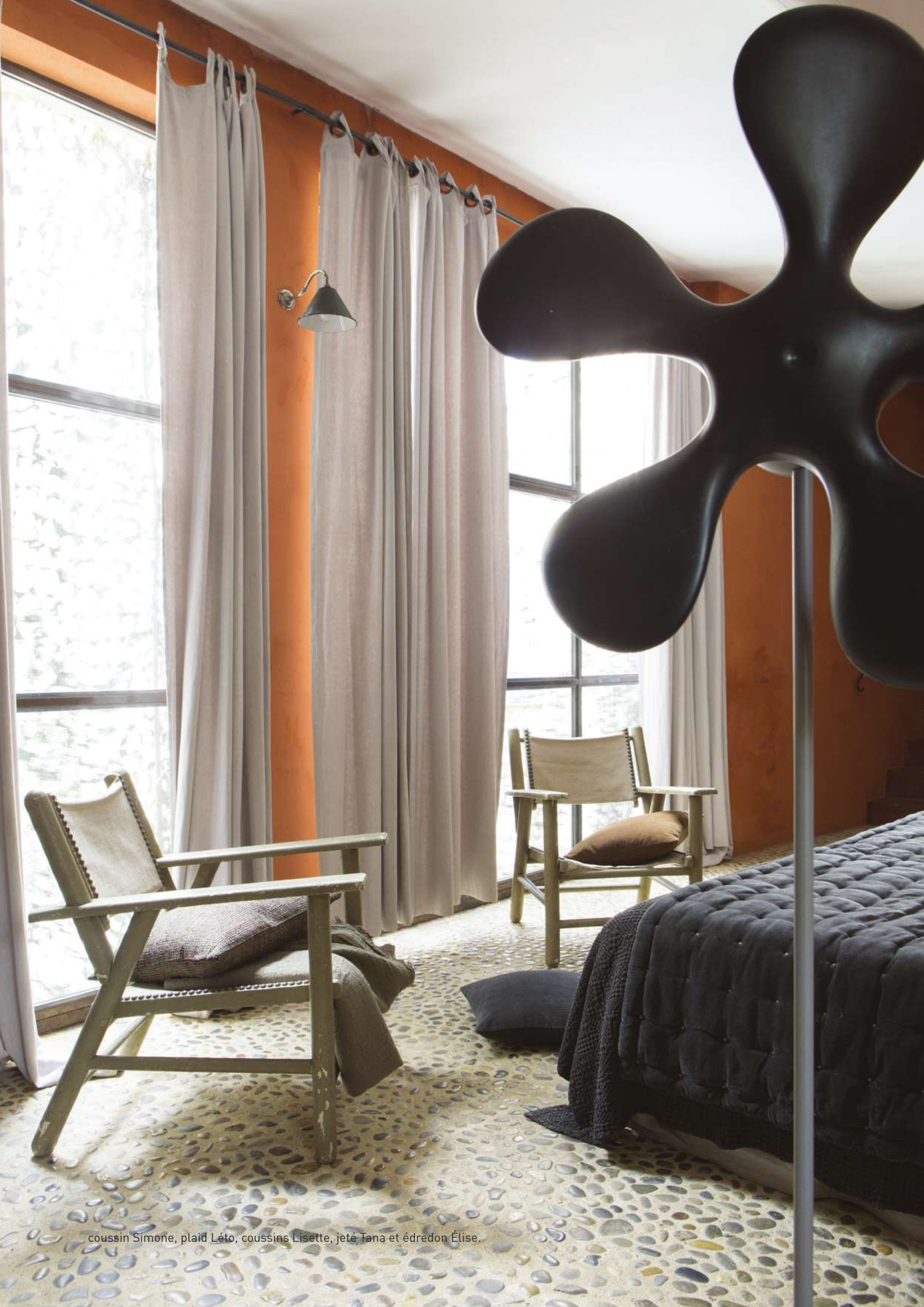
coussin Simone, plaid Léo, coussins Lisette, jete Tana et edredon Elise.