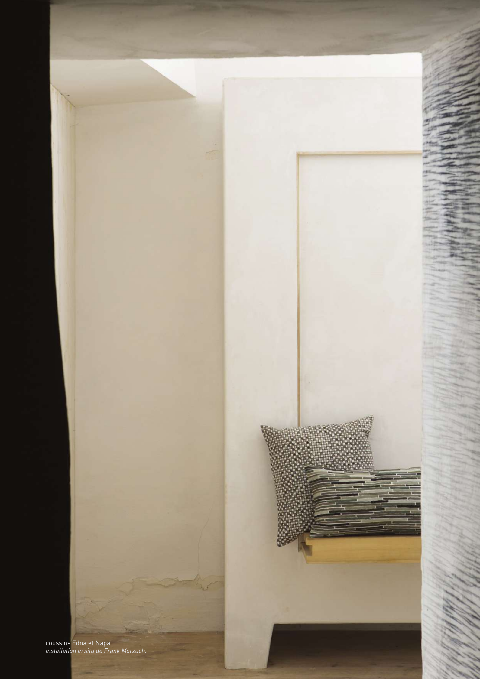
coussins Edna et Napa. installation in situ de Frank Morzuch.