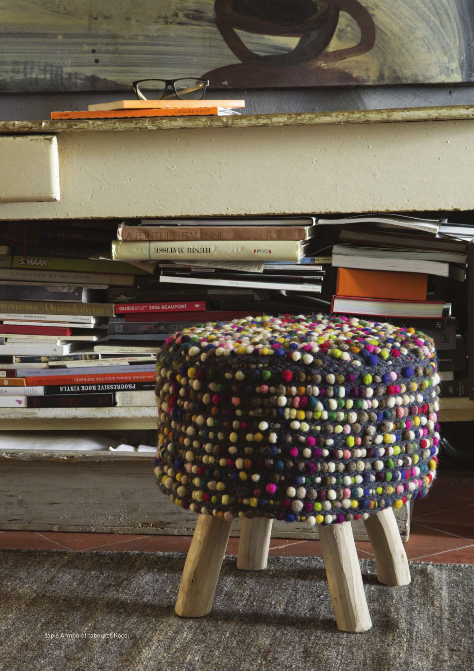
tapis Armen et tabouret Koco.