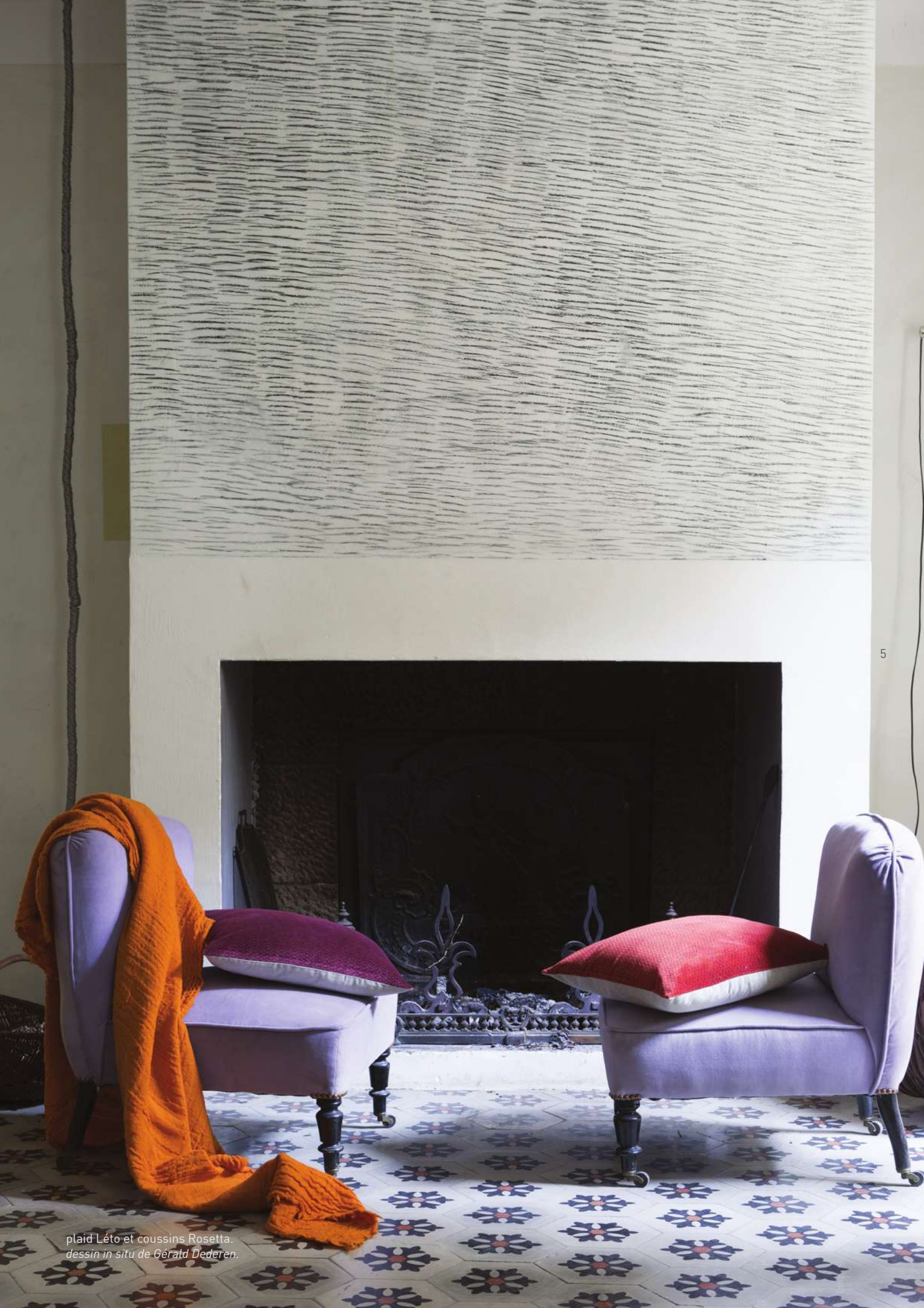
plaid Léto et coussins Rosetta. dessin in situ de Gérald Dederen.