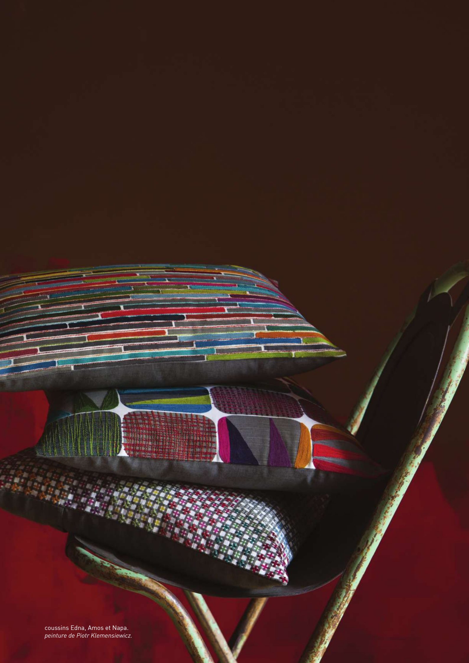
coussins Edna, Amos et Napa. peinture de Piotr Klemensiewicz.