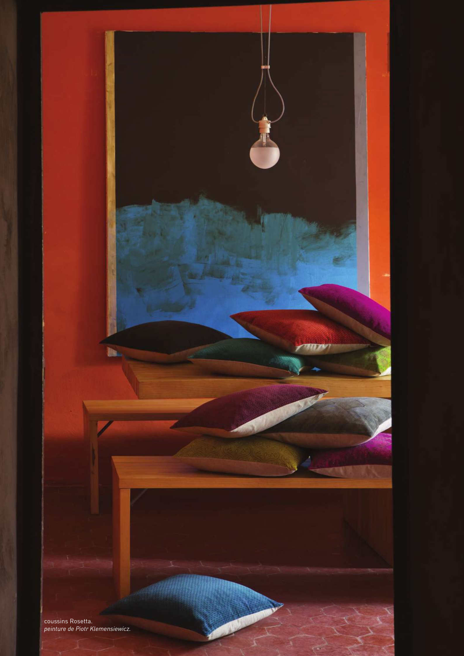
coussins Rosetta. peinture de Piotr Klemensiewicz.