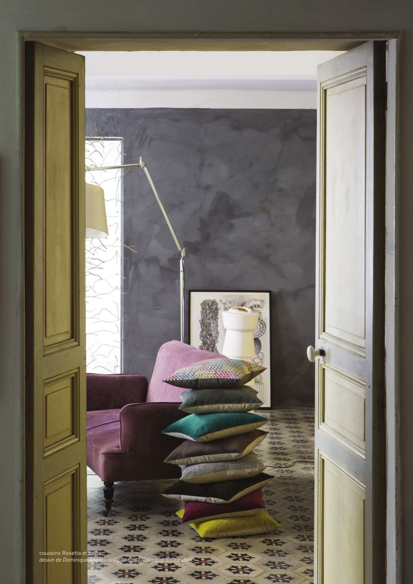
coussins Rosetta et Edna. dessin de Dominique Angel - sculpture de Frédérique Nalbandian.