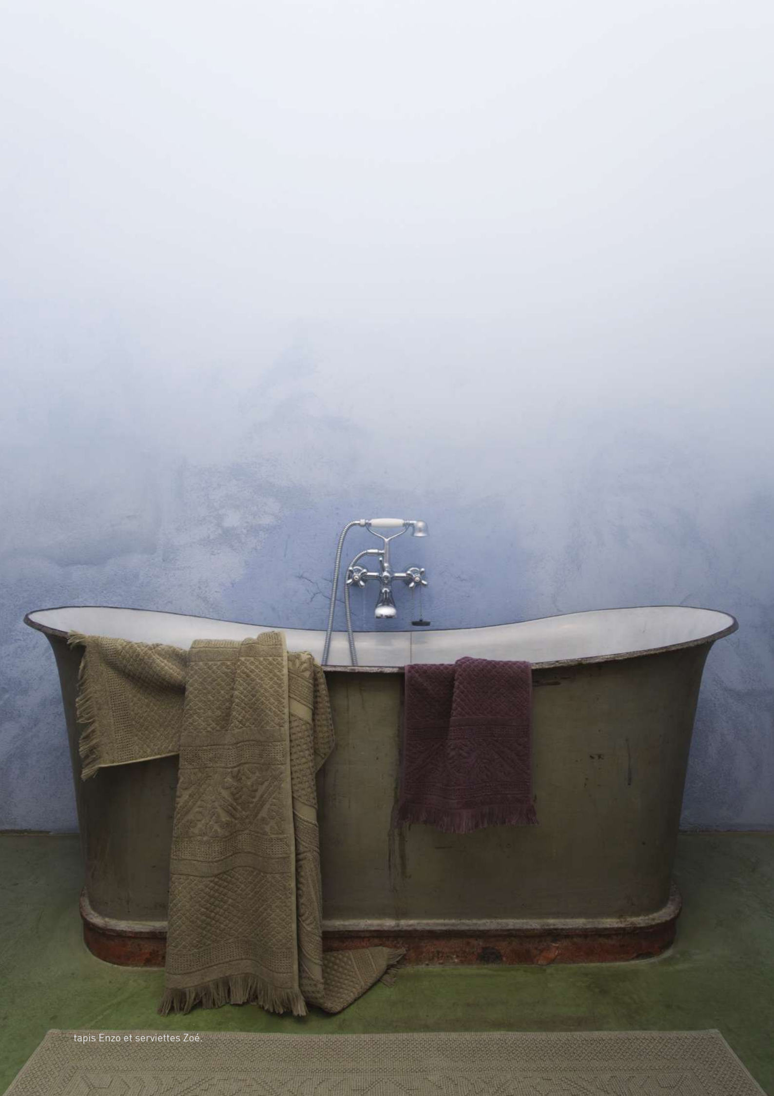
tapis Enzo et serviettes Zoé.