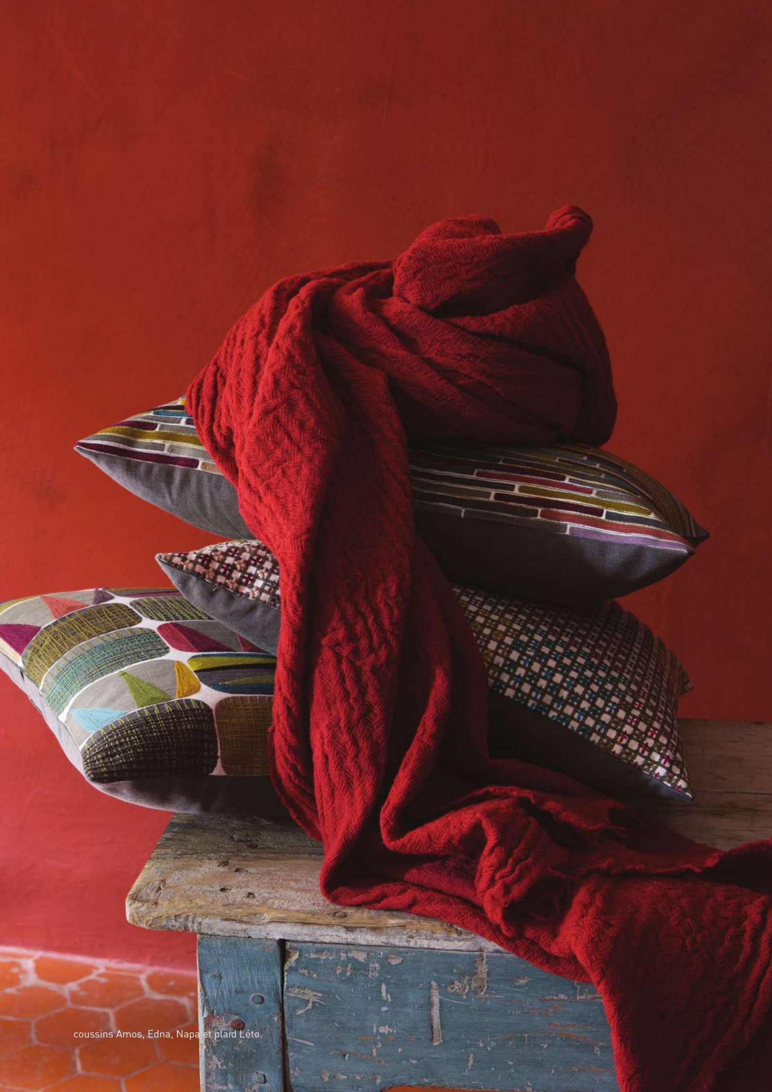
coussins Amos, Edna, Napa et plaid Léo.