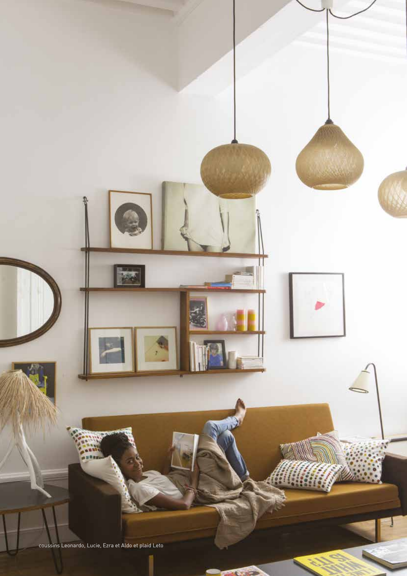
coussins Leonardo, Lucie, Ezra et Aldo et plaid Leto