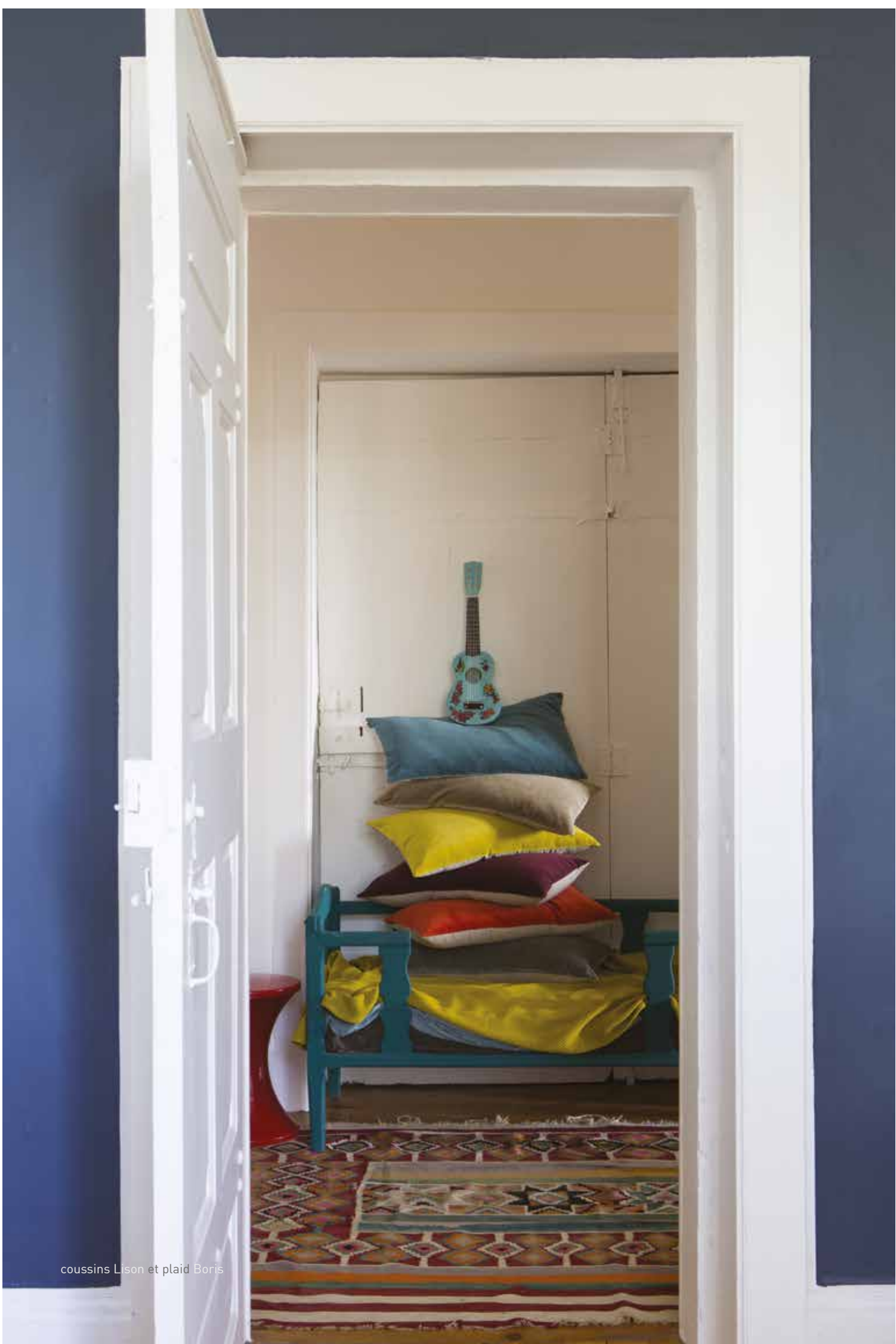
coussins Lison et plaid Boris