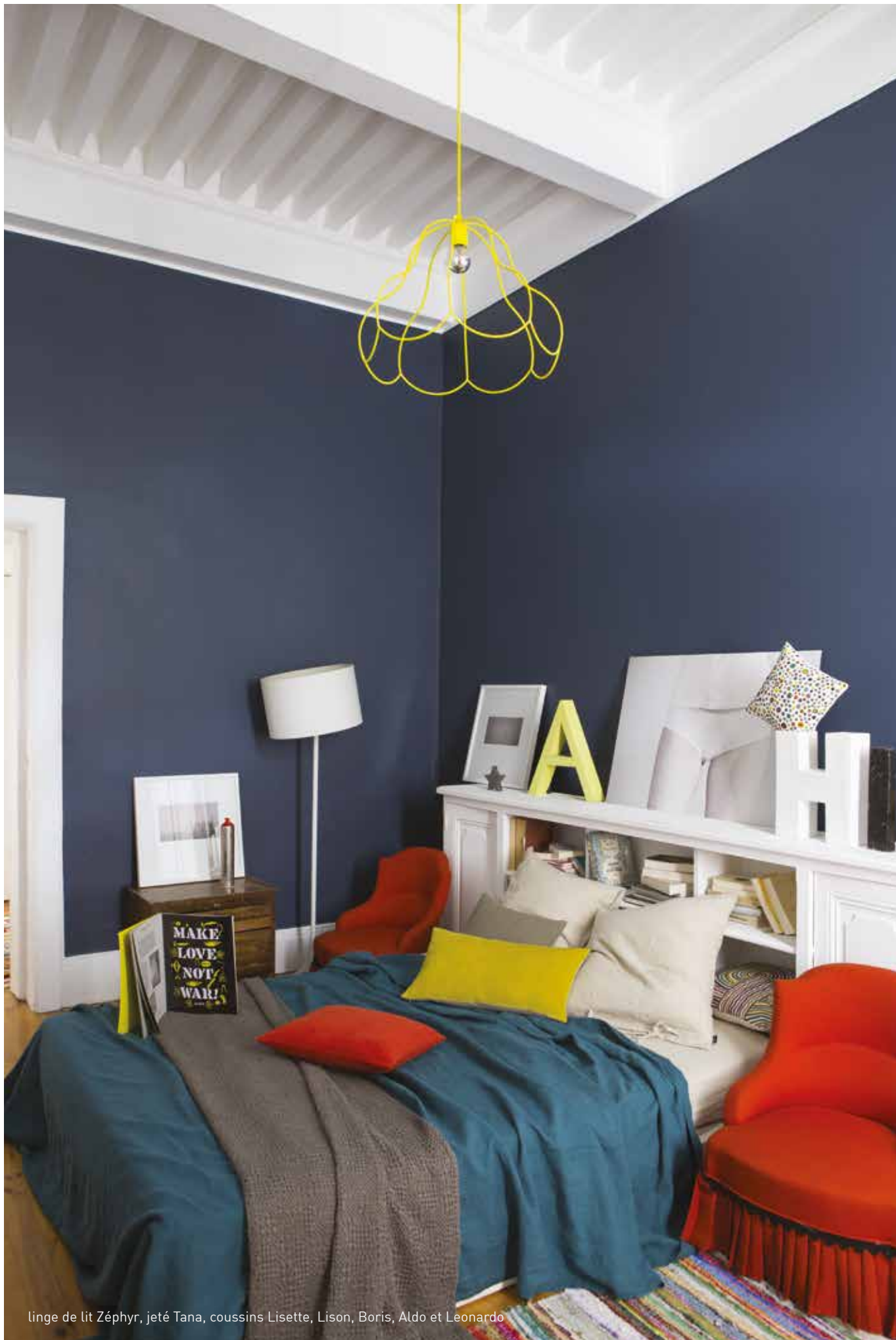
linge de lit Zéphyr, jeté Tana, coussins Lisette, Lison, Boris, Aldo et Leonardo