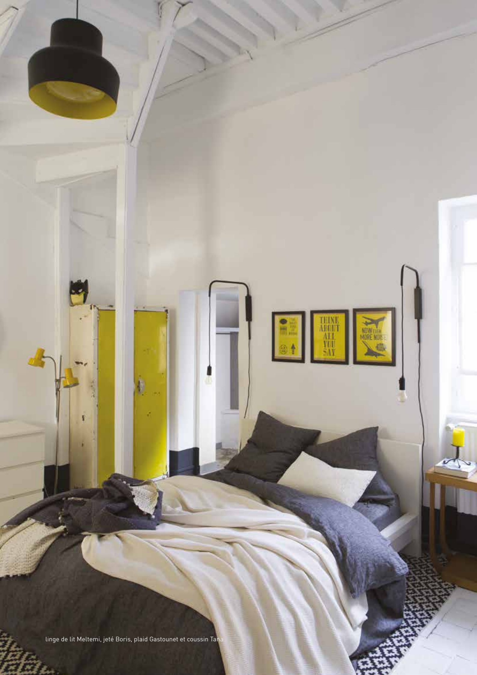
linge de lit Meltemi, jeté Boris, plaid Gastounet et coussin Tana