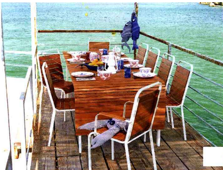
Tables estivales

Par Rouba Naaman-Beauvais, le 02 Juillet 2015