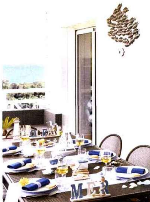
Tables estivales