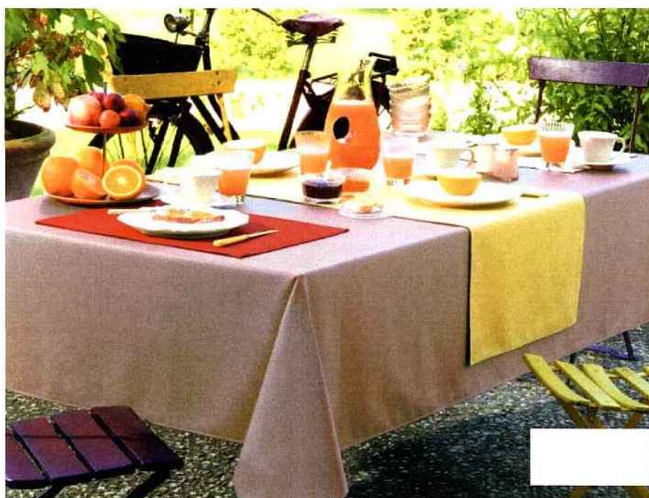
Tables estivales

On mange dehors sur... une table qui combine les couleurs ! Jaune et violet pour les chaises, argile pour la nappe, rouge pour les sets de table, jaune pour le chemin de table. L'esprit "color block" appliqué à la table de jardin.