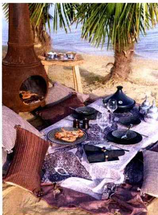
Tables estivales © Ambiance & Styles