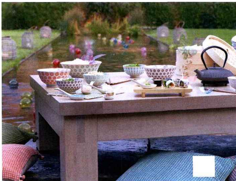
Tables estivales

On mange dehors sur... une table basse autour de laquelle on s'assied, à la japonaise. Au programme : thé dans une théière traditionnelle et sushis sur des tablettes en bois. La vaisselle d'inspiration asiatique arbore des motifs contemporains et estivaux.