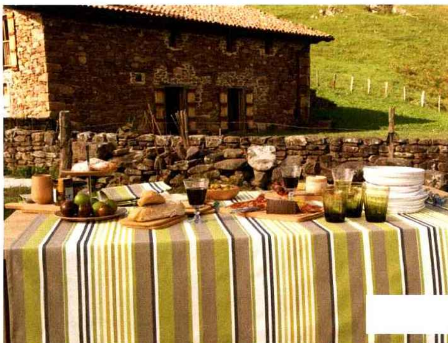
Tables estivales © Tissage de Luz

On mange dehors sur... une nappe aux fines rayures basques. Ses couleurs naturelles créent une ambiance authentique et chaleureuse.