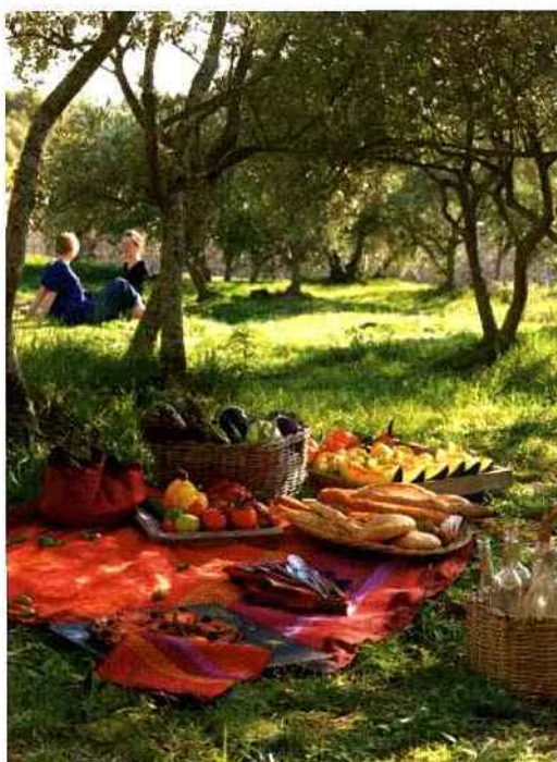
Tables estivales

On mange dehors sur... une nappe rouge et orange, chaleureuse et estivale. Elle appelle un repas convivial, provençal, baigné de soleil.