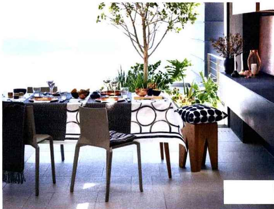
Tables estivales

On mange dehors sur... une table en bois qui joue sur le chic bicolore. Une nappe, deux chemins de table parallèles et des coussins, tous noir et blanc, apportent une élégance à cette table, qui pourrait aussi bien s'imaginer dedans.