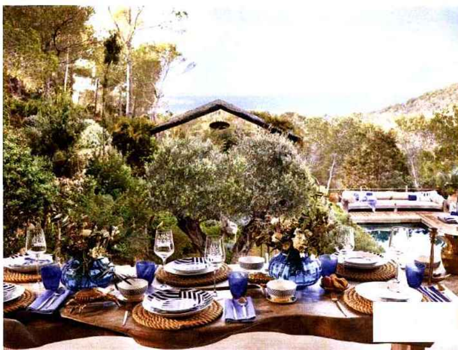
Tables estivales

On mange dehors sur... une table en bois dont la forme rappelle le bois flotté. Sa beauté lui permet de se passer de nappe, mais on la décore quand même, avec des coloris marins et des matières nobles.