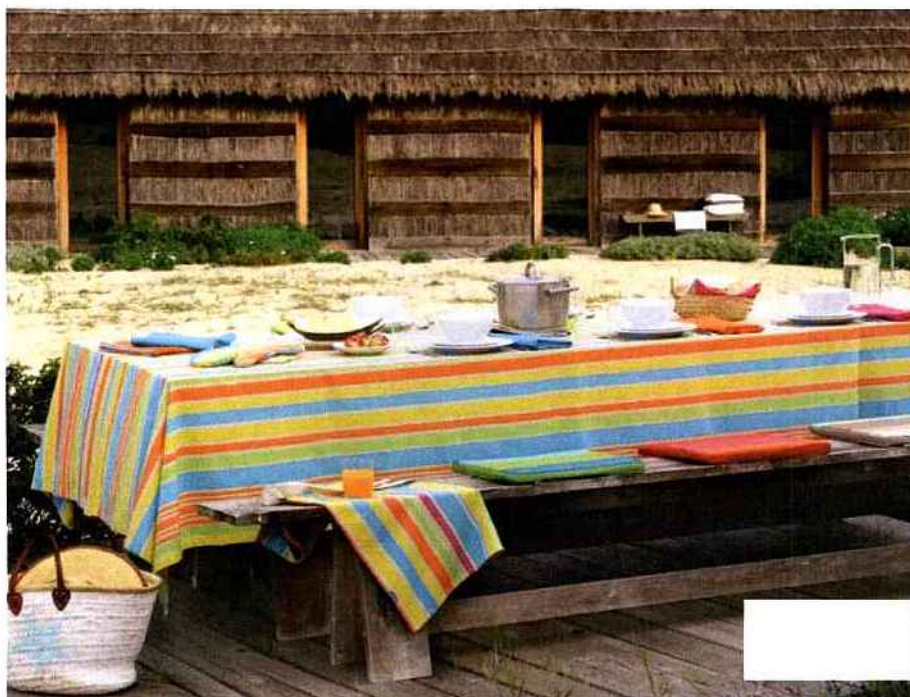
Tables estivales

On mange dehors sur... une grande table habillée d'une nappe aux rayures vitaminées et énergisantes. Ambiance familiale et festive, pour un déjeuner sur la plage qui se prolonge.