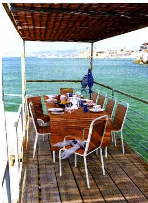
Tables estivales

On mange dehors sur... une table en bois à lames, façon pont de bateau. L'inspiration maritime est contrebalancée par une vaisselle aux motifs végétaux.