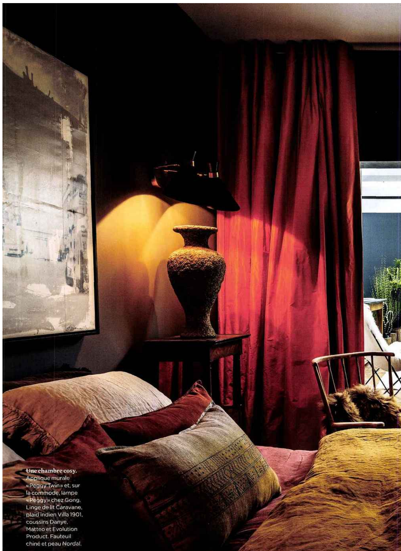
Une chambre cosy. Applique murale «Peggy Twin» et, sur la commode, lampe «Peggy» chez Gong. Linge de lit Caravane, plaid indien Villa 1901, coussins Danye, Matteo et Evolution Product. Fauteuil chiné et peau Nordal.