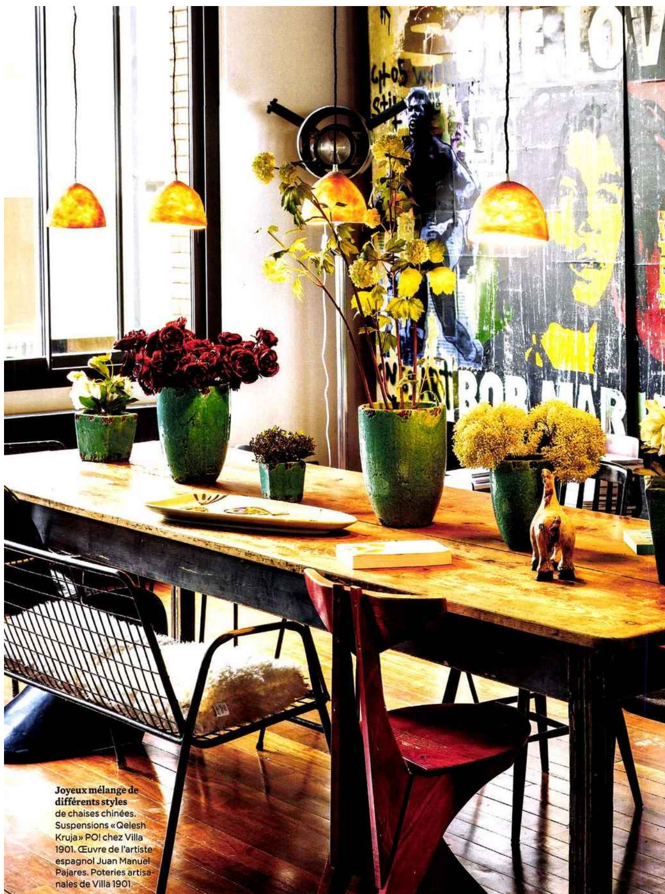
Joyeux mélange de différents styles de chaises chinées. Suspensions « Qelesh Kruja » PO! chez Villa 1901. Œuvre de l'artiste espagnol Juan Manuel Pajares. Poteries artisanales de Villa 1901.