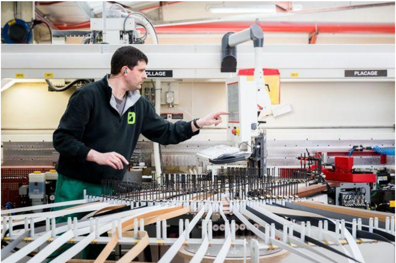
La machine FLEX, nouvel outil de production chez Gautier.

ou une idée ". L'inventivité fait le reste. Les essais les plus concluants passent en prototypes avant de servir les futures collections. L'avantage de ce système est de permettre aux employés de participer d'une autre manière à l'amélioration des produits Gautier, et ce peu importe leur secteur d'activité.