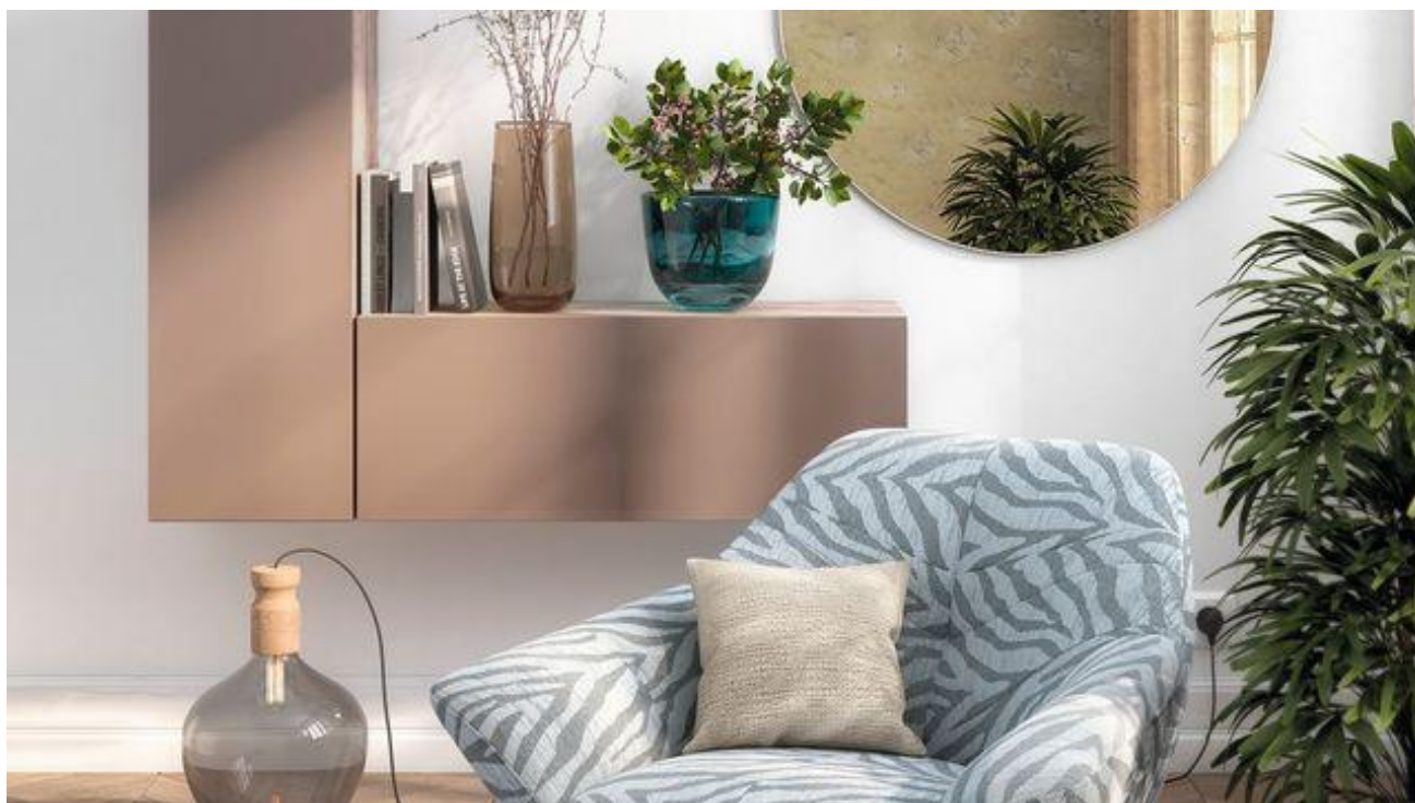
Meuble Gautier : les dessous d'une fabrication française