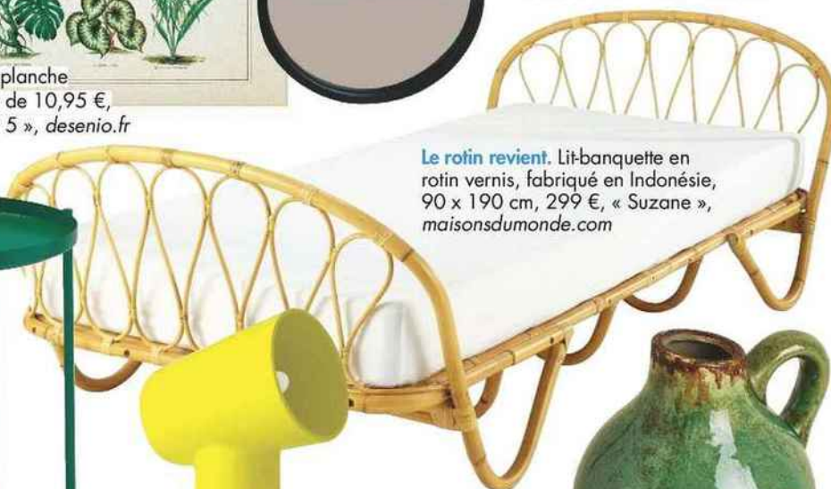
Le rotin revient. Lit-banquette en rotin vernis, fabriqué en Indonésie, 90 x 190 cm, 299 €, « Suzane », maisonsdumonde.com