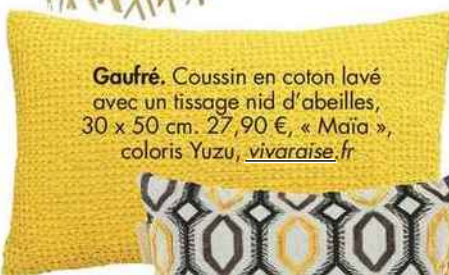
Gaufré. Coussin en coton lavé avec un tissage nid d'abeilles, 30 x 50 cm. 27,90 €, « Maïa », coloris Yuzu, vivaraise.fr