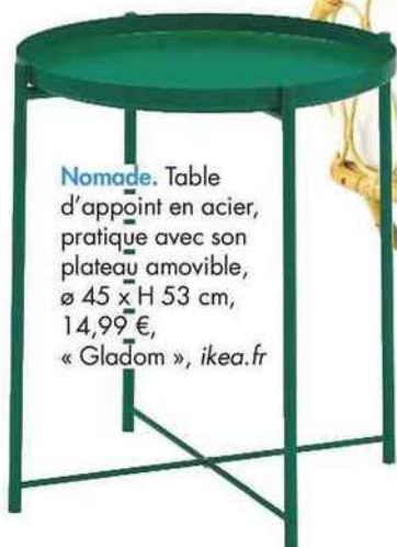
Nomade. Table d'appoint en acier, pratique avec son plateau amovible, ø 45 x H 53 cm, 14,99 €, « Gladom », ikea.fr