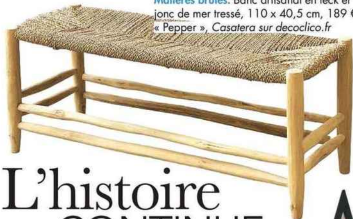
Matières brutes. Banc artisanal en teck et jonc de mer tressé, 110 x 40,5 cm, 189 €, « Pepper », Casatera sur decoclico.fr