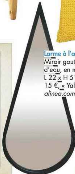
Larme à l'œil. Miroir goutte d'eau, en métal, L 22 x H 51 cm, 15 €, « Yala », alineacom.com