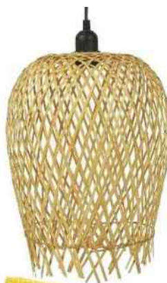
Ajourée. Suspension en fibres de bambou tressées, ø 24 x H 39 cm, 39,90 €, « Vela », ostaria.fr