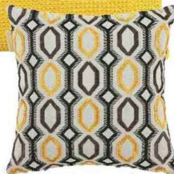
Hypnothérapie. Enveloppe de coussin en polyester et coton avec motif hexagonal brodé, 40 x 40 cm, 35 €, « Bartolo », madura.fr